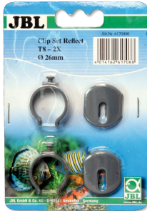
JBL SOLAR REFLECT Clip Set Halterung für Leuchtstoffröhren