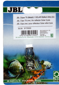
JBL Clipse T5/T8 Metall Metallhalterung für Leuchtstoffröhren